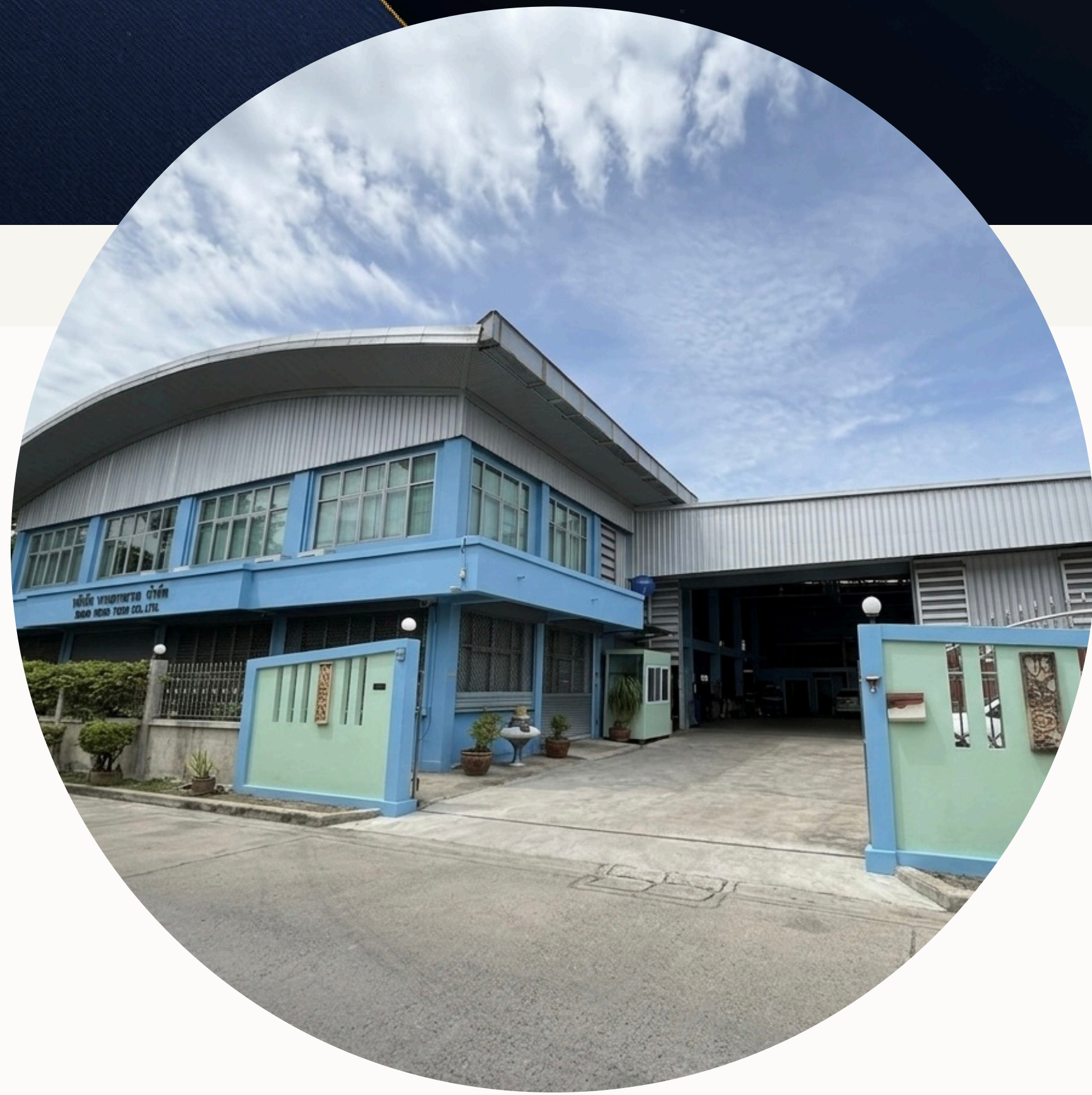
บริษัท บางยางเทค จำกัด BANGYANG TECH CO., LTD.